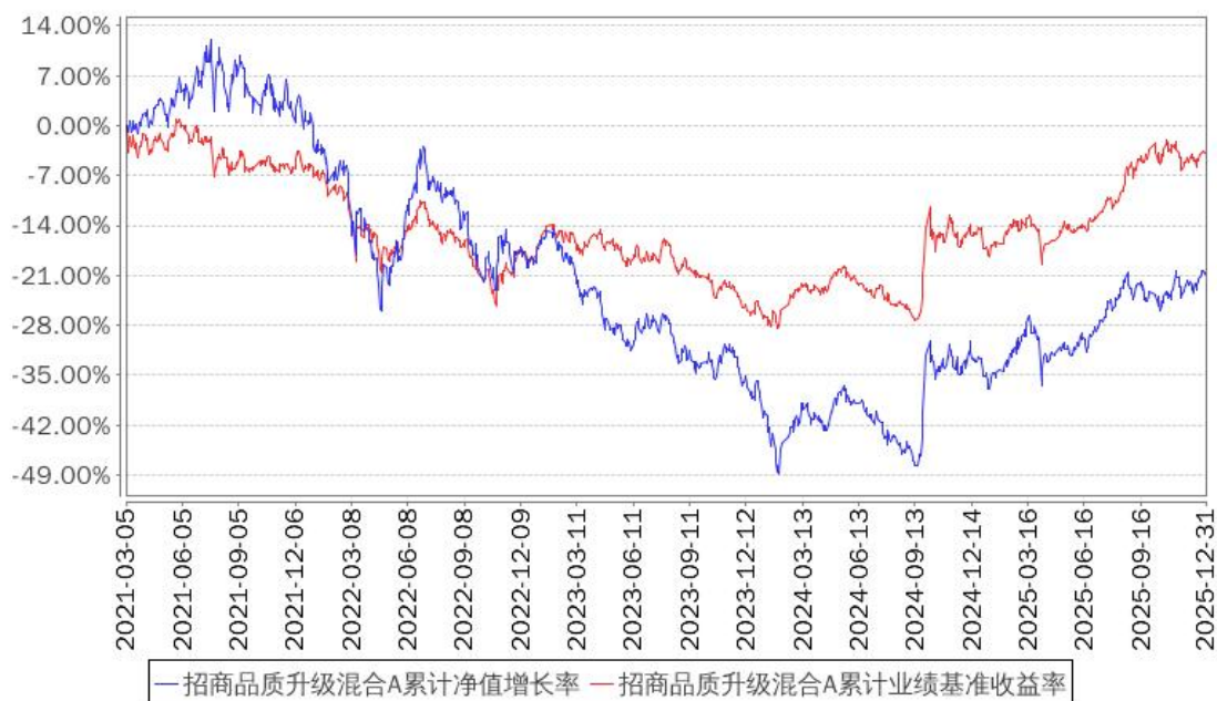
招商品质升级混合A累计净值增长率与同期业绩比较基准收益率的历史走势对比图