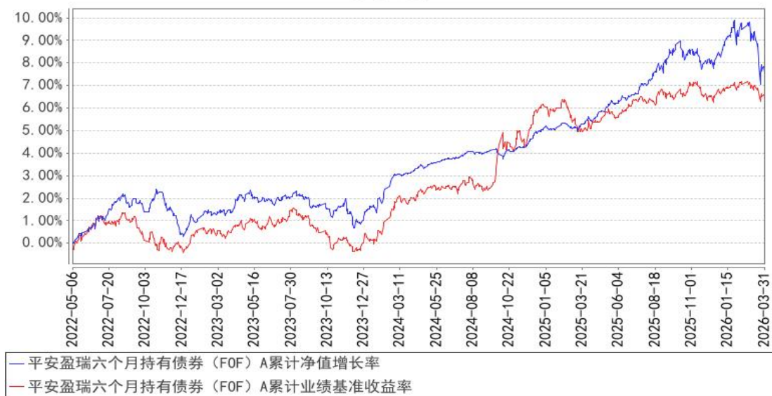
平安盈瑞六个月持有债券（FOF）A累计净值增长率与同期业绩比较基准收益率的历史走势对比图