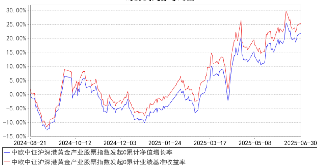
中欧中证沪深港黄金产业股票指数发起C累计净值增长率与同期业绩比较基准收益率的历史走势对比图

注：本基金基金合同生效日期为 2024 年 8 月 21 日，自基金合同生效日起到本报告期末不满一年，按基金合同的规定，本基金自基金合同生效起六个月为建仓期，建仓期结束时各项资产配置比例已经符合基金合同约定。