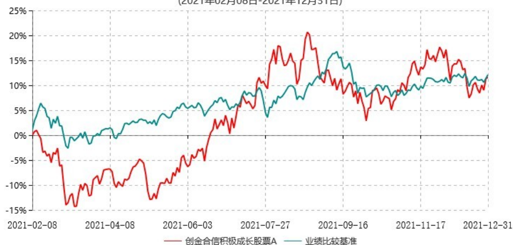
创金合信积极成长股票A累计净值增长率与业绩比较基准收益率历史走势对比图 (2021年02月08日-2021年12月31日)