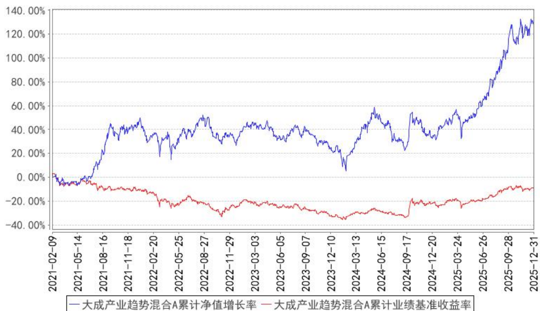
大成产业趋势混合A累计净值增长率与同期业绩比较基准收益率的历史走势对比图

(二) 自基金合同生效以来基金份额累计净值增长率变动及其与同期业绩比较基准收益率变动的比较