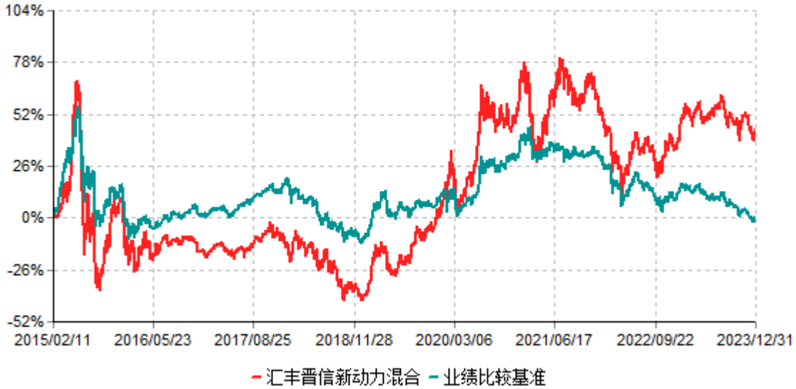
汇丰晋信新动力混合型证券投资基金累计净值增长率与业绩比较基准收益率历史走势对比图 (2015年02月11日-2023年12月31日)