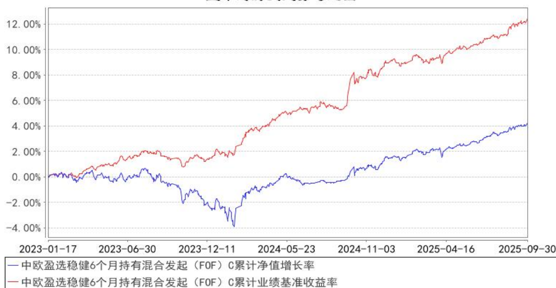
中欧盈选稳健6个月持有混合发起（FOF）C累计净值增长率与同期业绩比较基准收益率的历史走势对比图

注：2024 年 8 月 19 日起，组合业绩比较基准变更为中证纯债债券型基金指数收益率*87%+沪深 300 指数收益率*10%+上海黄金交易所 Au99.99 现货实盘合约收益率*3%。