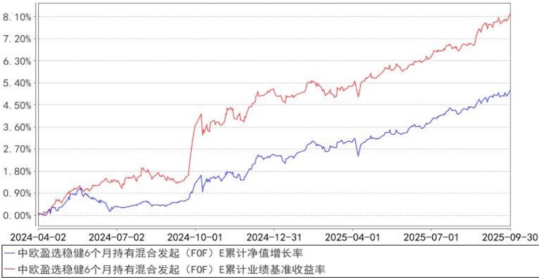
中欧盈选稳健6个月持有混合发起（FOF）E累计净值增长率与同期业绩比较基准收益率的历史走势对比图

注：2024 年 8 月 19 日起，组合业绩比较基准变更为中证纯债债券型基金指数收益率*87%+沪深 300 指数收益率*10%+上海黄金交易所 Au99.99 现货实盘合约收益率*3%。本基金于 2024 年 3 月 28 日新增 E 类份额，图示日期为 2024 年 4 月 2 日至 2025 年 09 月 30 日。