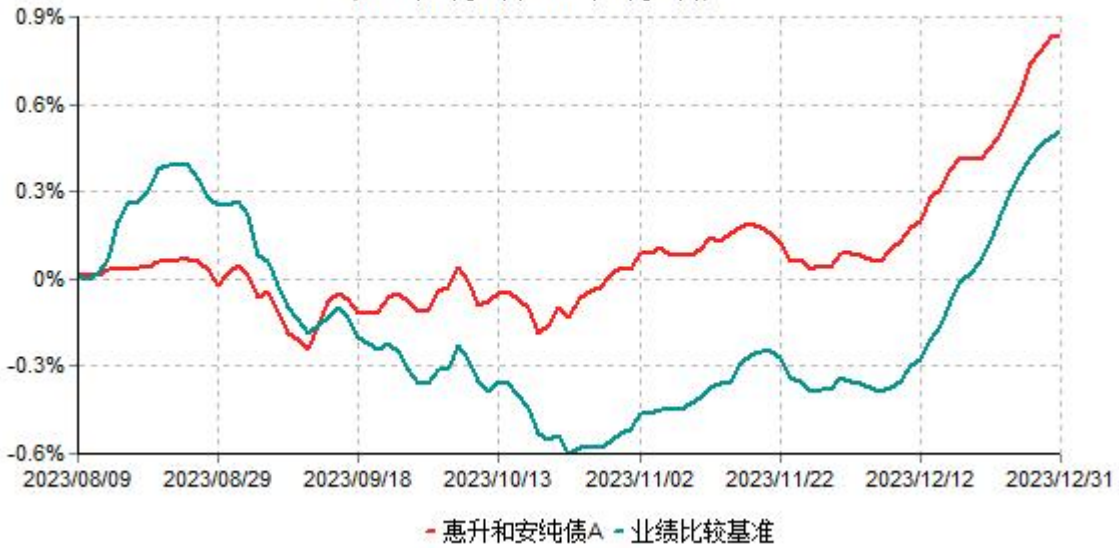
惠升和安纯债A累计净值增长率与业绩比较基准收益率历史走势对比图 (2023年08月09日-2023年12月31日)