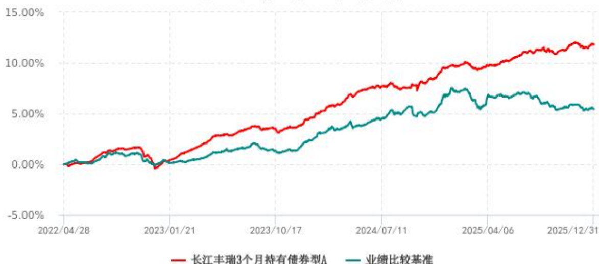
长江丰瑞3个月持有债券型A累计净值增长率与业绩比较基准收益率历史走势对比图 (2022年04月28日-2025年12月31日)