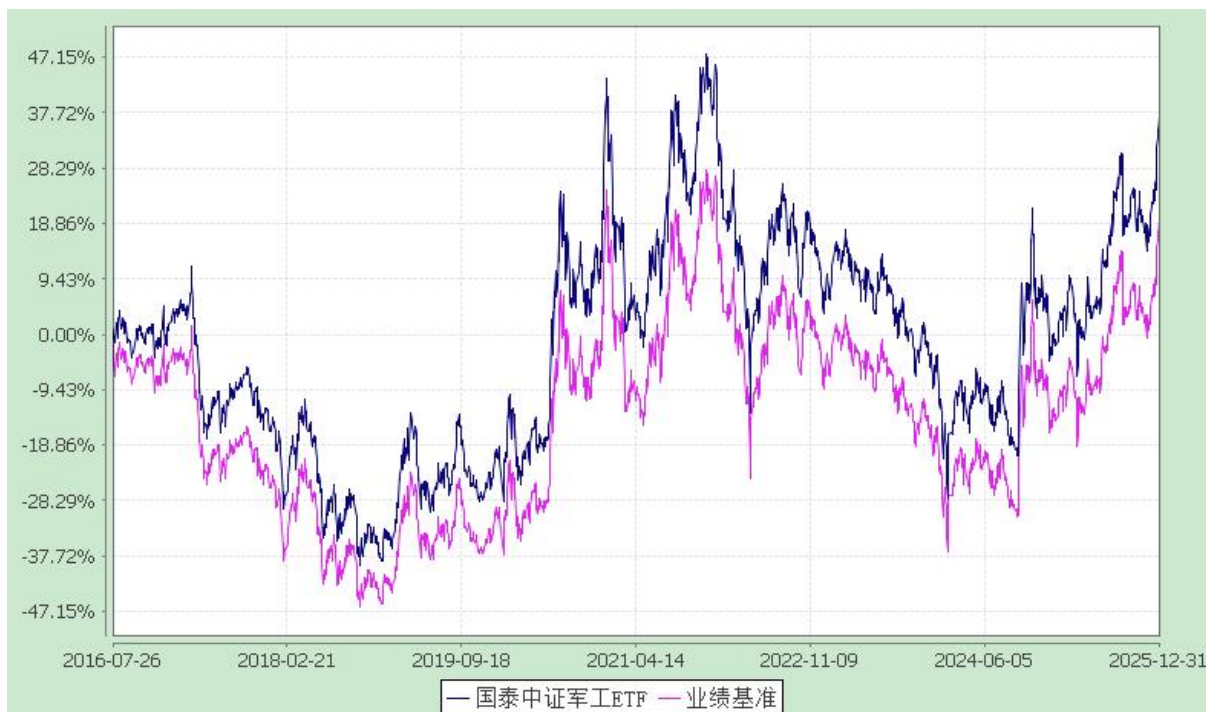
自基金合同生效以来份额累计净值增长率与业绩比较基准收益率的历史走势对比图 (2016 年 7 月 26 日至 2025 年 12 月 31 日)

注：本基金合同生效日为 2016 年 7 月 26 日，在六个月建仓期结束时，各项资产配置比例符合合同约定。