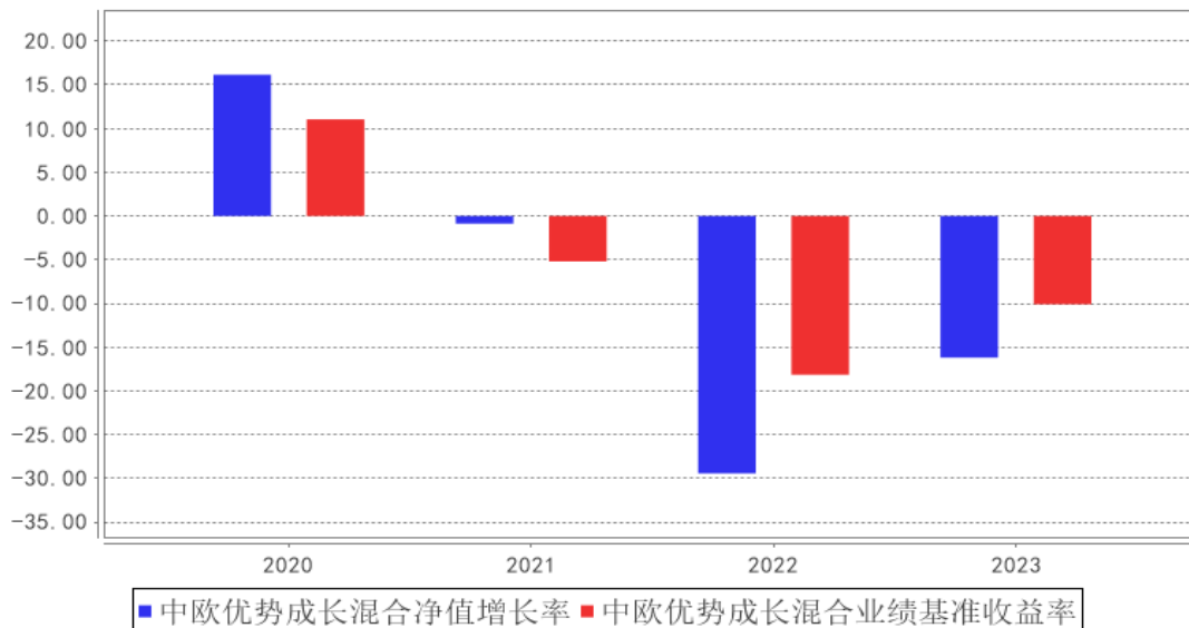
中欧优势成长混合基金每年净值增长率与同期业绩比较基准收益率的对比图

注：本基金合同生效日为 2020 年 09 月 18 日，2020 年度数据为 2020 年 09 月 18 日至 2020 年 12 月 31 日数据。