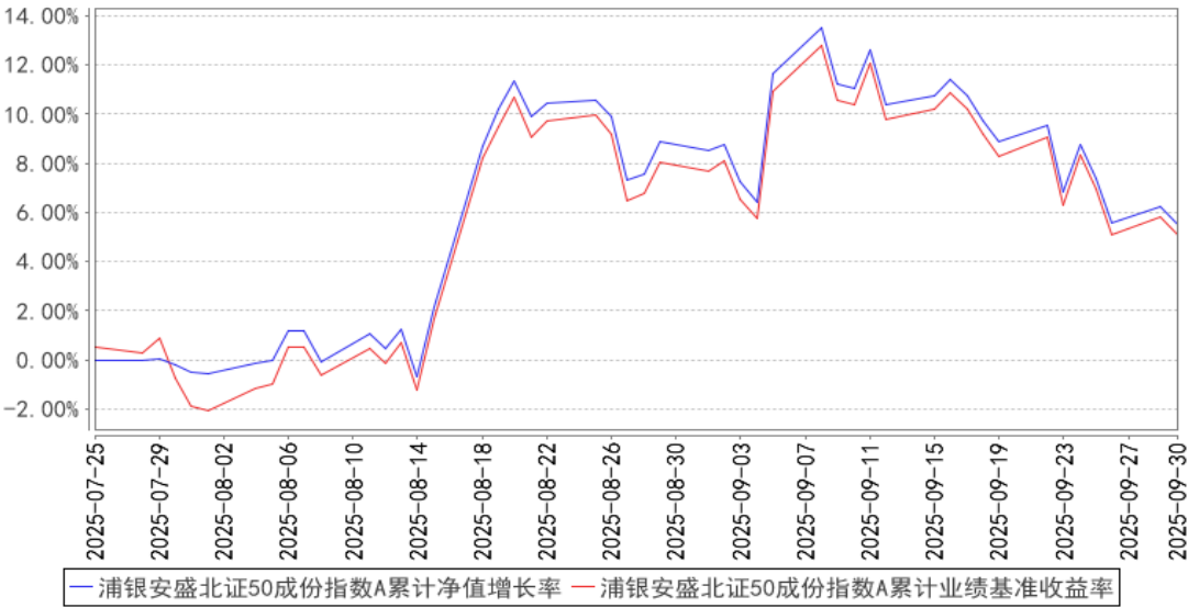
浦银安盛北证50成份指数A累计净值增长率与同期业绩比较基准收益率的历史走势 对比图