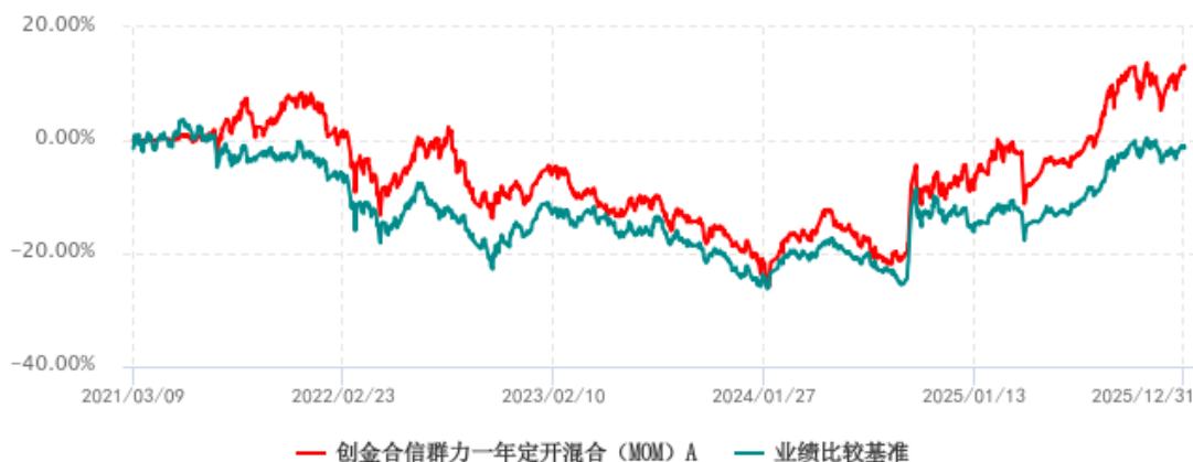
创金合信群力一年定开混合（MOM）A 累计净值增长率与业绩比较基准收益率历史走势对比图 (2021年03月09日-2025年12月31日)