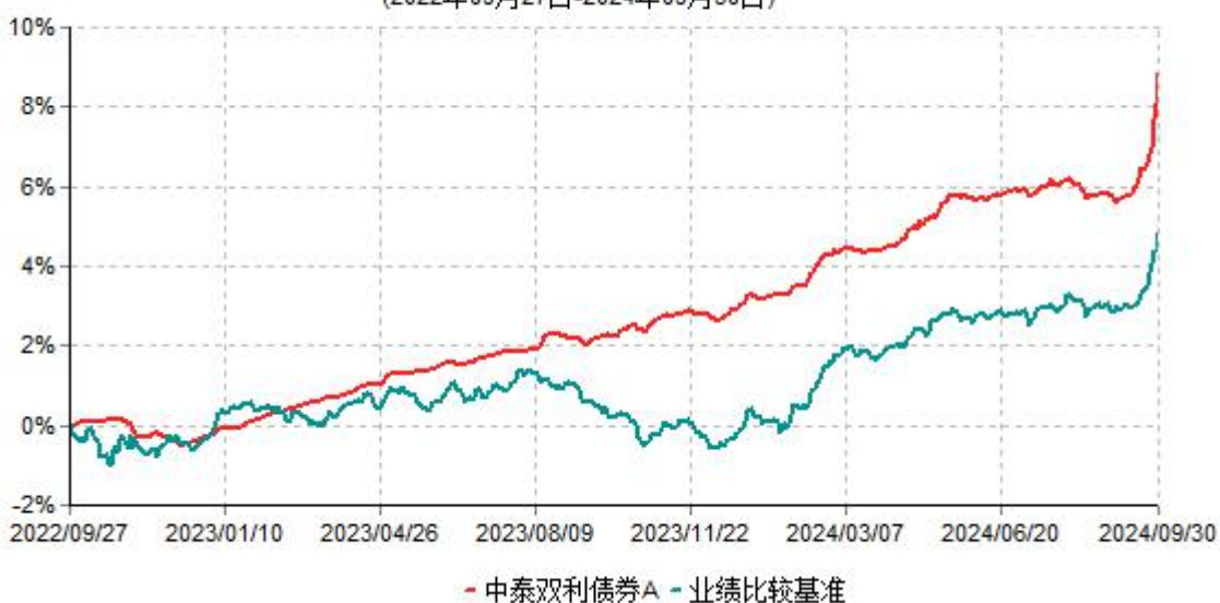
中泰双利债券A累计净值增长率与业绩比较基准收益率历史走势对比图 (2022年09月27日-2024年09月30日)