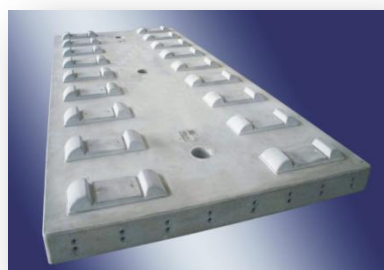
高速铁路无砟轨道板