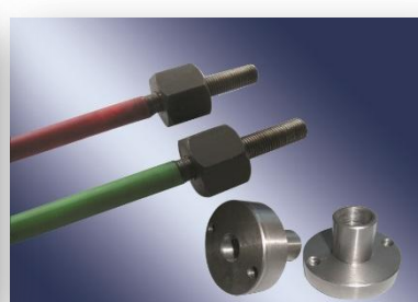
无粘结预应力钢棒