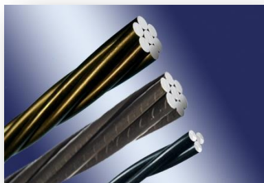
各品种预应力钢绞线