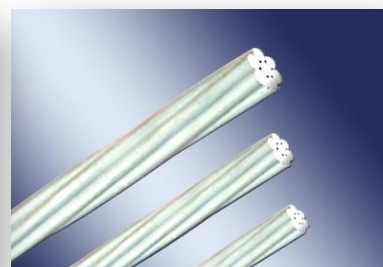
镀锌预应力钢绞线