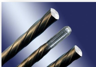
螺旋肋预应力钢丝