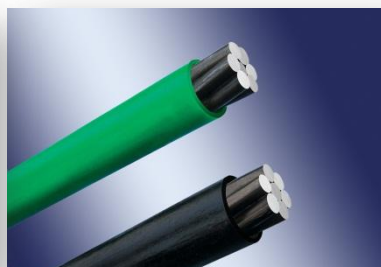
无粘结预应力钢绞线