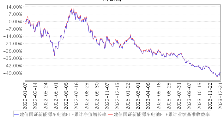
建信国证新能源车电池ETF累计净值增长率与同期业绩比较基准收益率的历史走势对比图