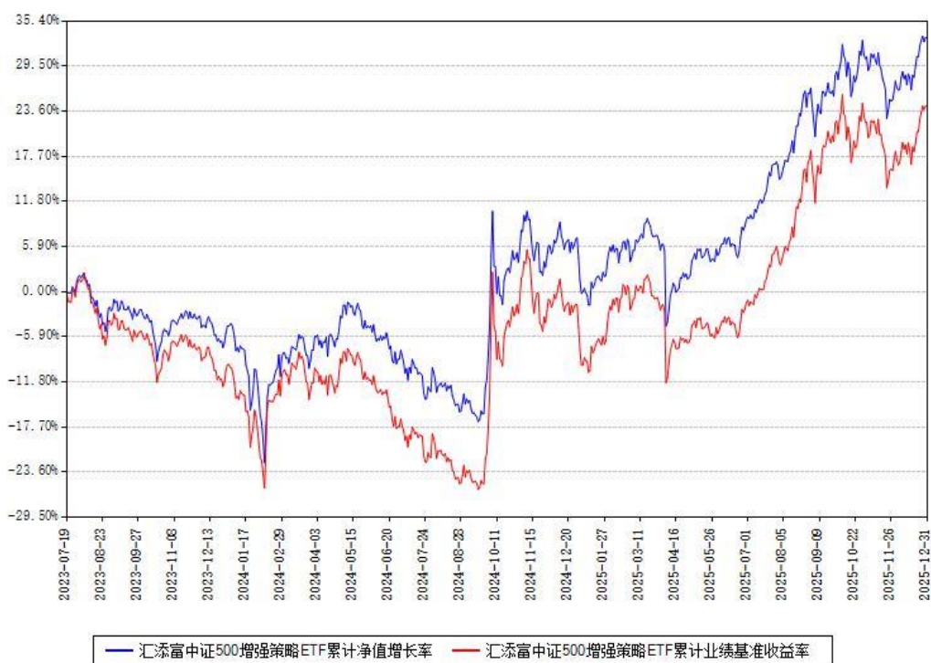
汇添富中证500增强策略ETF累计净值增长率与同期业绩比较基准收益率对比图

注：本基金建仓期为本《基金合同》生效之日（2023年07月19日）起6个月，建仓期结束时各项资产配置比例符合合同约定。