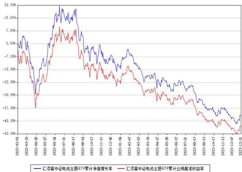
汇添富中证电池主题ETF累计净值增长率与同期业绩基准收益率对比图

注：本基金建仓期为本《基金合同》生效之日（2022年03月03日）起6个月，建仓期结束时各项资产配置比例符合合同约定。