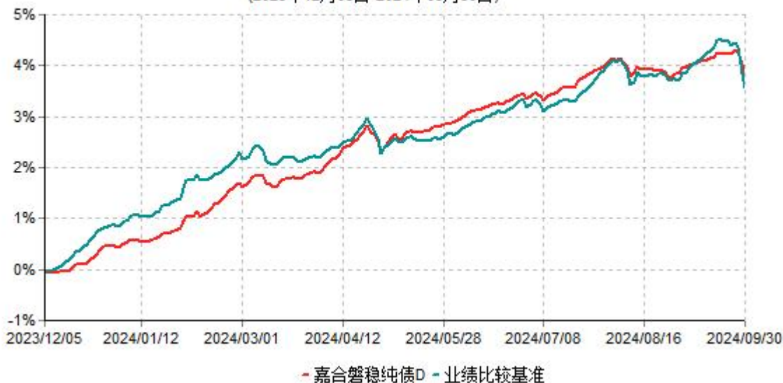
嘉合磐稳纯债D累计净值增长率与业绩比较基准收益率历史走势对比图 (2023年12月05日-2024年09月30日)

注：本基金于2023年12月05日增设D类基金份额，D类基金份额实际存续从2023年12月05日开始。