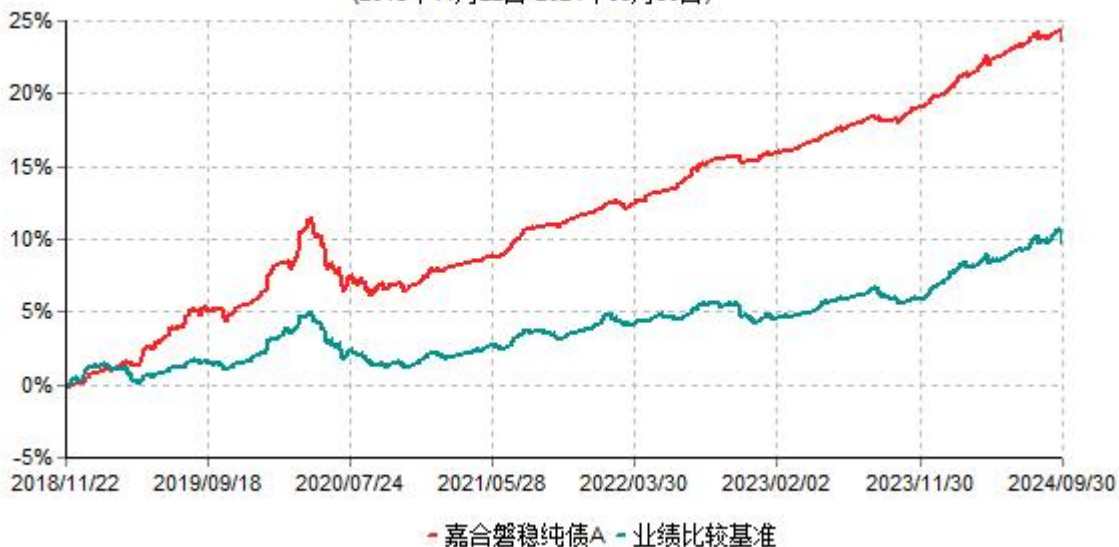
嘉合磐稳纯债A累计净值增长率与业绩比较基准收益率历史走势对比图 (2018年11月22日-2024年09月30日)