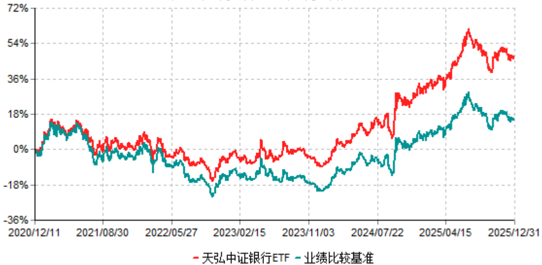
天弘中证银行ETF累计净值增长率与业绩比较基准收益率历史走势对比图 (2020年12月11日-2025年12月31日)