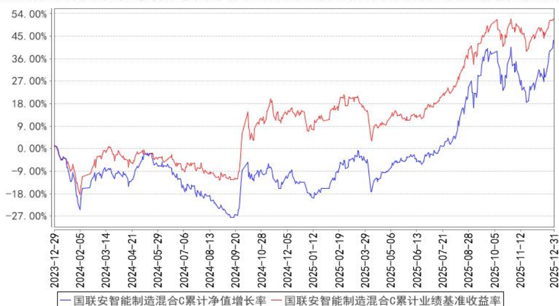
国联安智能制造混合C累计净值增长率与同期业绩比较基准收益率的历史走势对比图

注：1、国联安智能制造混合型证券投资基金于 2023 年 12 月 5 日起增加收取销售服务费的 C 类基金份额，并对本基金基金合同及托管协议作相应修改，原有的基金份额在增加收取销售服务费的