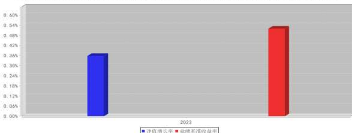
大成惠利纯债债券C基金每年净值增长率与同期业绩比较基准收益率的对比图（2023年12月31日）