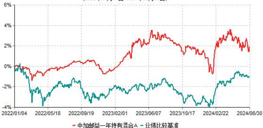
中加邮益一年持有混合A累计净值增长率与业绩比较基准收益率历史走势对比图 (2022年01月04日-2024年06月30日)