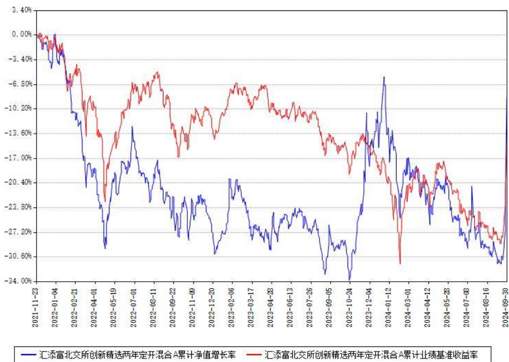
汇添富北交所创新精选两年定开混合A累计净值增长率与同期业绩基准收益率对比图