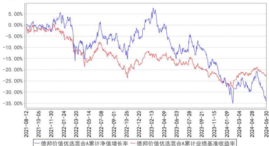
德邦价值优选混合A累计净值增长率与同期业绩比较基准收益率的历史走势对比图