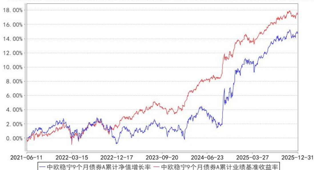
中欧稳宁9个月债券A累计净值增长率与同期业绩比较基准收益率的历史走势对比图