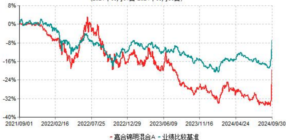
嘉合锦明混合A累计净值增长率与业绩比较基准收益率历史走势对比图 (2021年09月01日-2024年09月30日)