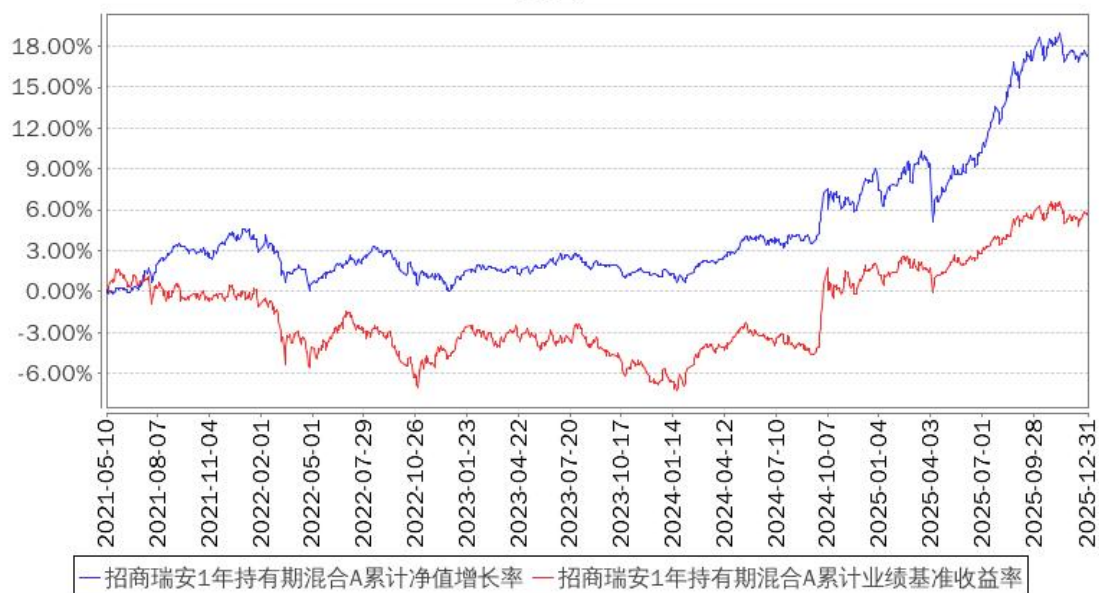
招商瑞安1年持有期混合A累计净值增长率与同期业绩比较基准收益率的历史走势对比图