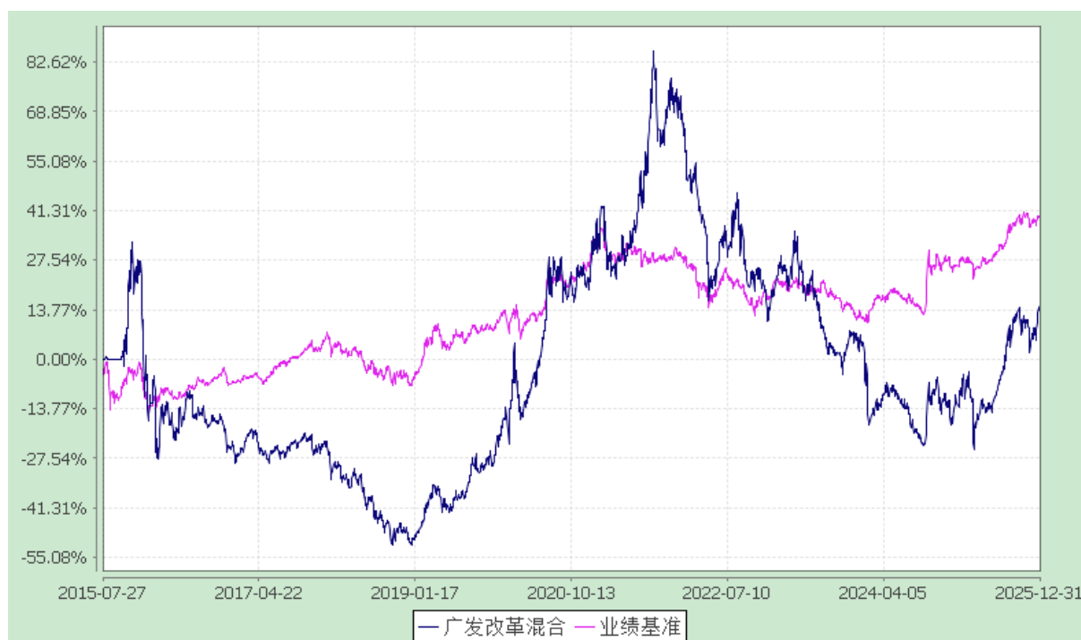
广发改革先锋灵活配置混合型证券投资基金 份额累计净值增长率与业绩比较基准收益率的历史走势对比图 (2015年7月27日至2025年12月31日)