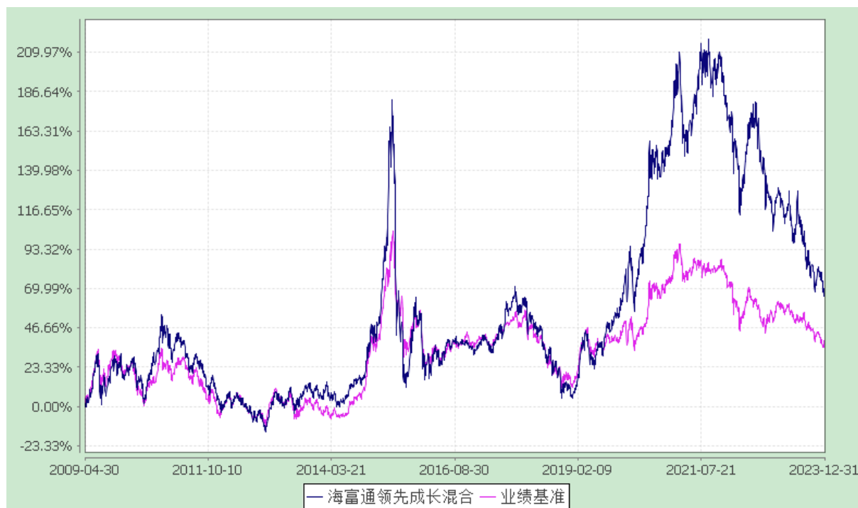
海富通领先成长混合型证券投资基金 份额累计净值增长率与业绩比较基准收益率的历史走势对比图 (2009年4月30日至2023年12月31日)

注：按照基金合同规定，本基金建仓期为基金合同生效之日起六个月，即 2009 年 4 月 30 日至 2009 年 10 月 29 日。建仓期结束时本基金投资组合均达到本基金合同第十二条（二）、（七）规定的比例限制及本基金投资组合的比例范围。