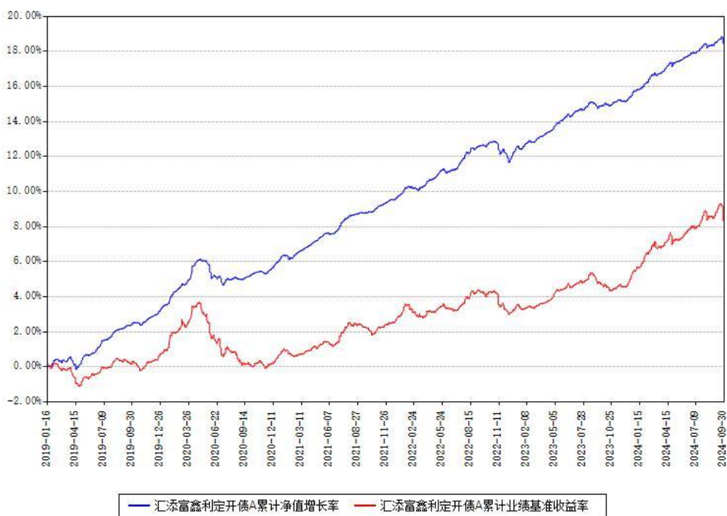
汇添富鑫利定开债A累计净值增长率与同期业绩基准收益率对比图

(二)自基金合同生效以来基金累计净值增长率变动及其与同期业绩比较基准收益率变动的比较图