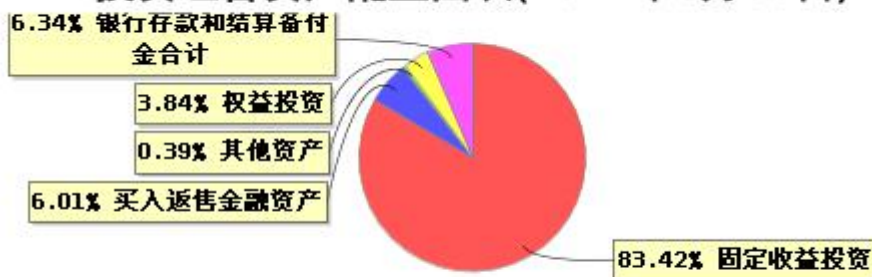
投资组合资产配置图表(2024年6月30日)

● 固定收益投资 ● 买入返售金融资产 ● 其他资产 ● 权益投资 ● 银行存款和结算备付金合计