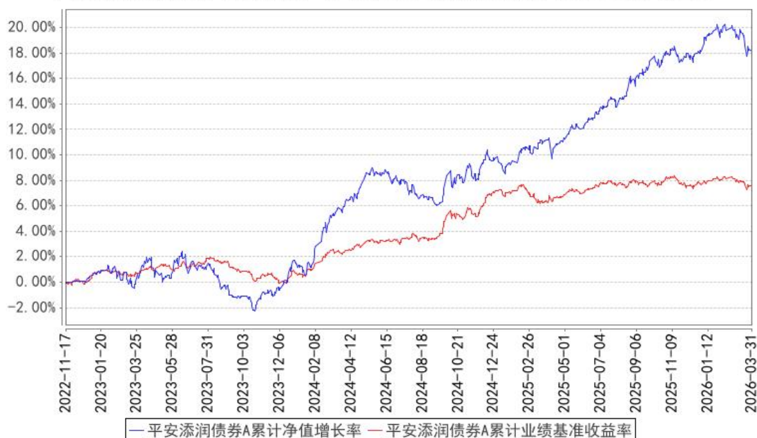
平安添润债券A累计净值增长率与同期业绩比较基准收益率的历史走势对比图