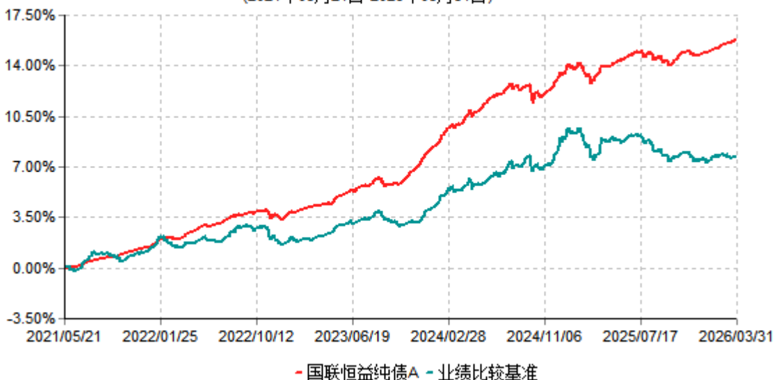
国联恒益纯债A累计净值增长率与业绩比较基准收益率历史走势对比图 (2021年05月21日-2026年03月31日)