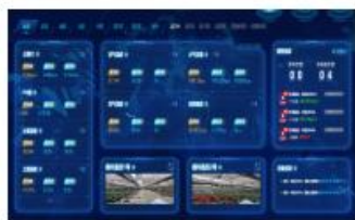
花卉温室环境监测预警