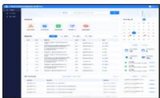
农业科技服务平台

公司通过上农易开展智慧农业领域相关软硬件技术研发及应用解决方案,助力国家乡村振兴战略。通过对农业大数据及相关领域的技术研发、技术服务,服务数字化转型的国家战略,提高数据资源价值创造能力。在农业科技服务平台项目、崖州湾实验室南繁用地共享平台、长宁社区综合服务屏项目、花卉工厂智能化生产管理系统、青扁豆周年智能化生产技术开发与集成项目等方面进行了相关应用研发推进及落地。