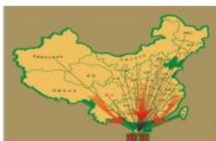
崖州湾实验室南繁用地共享平台