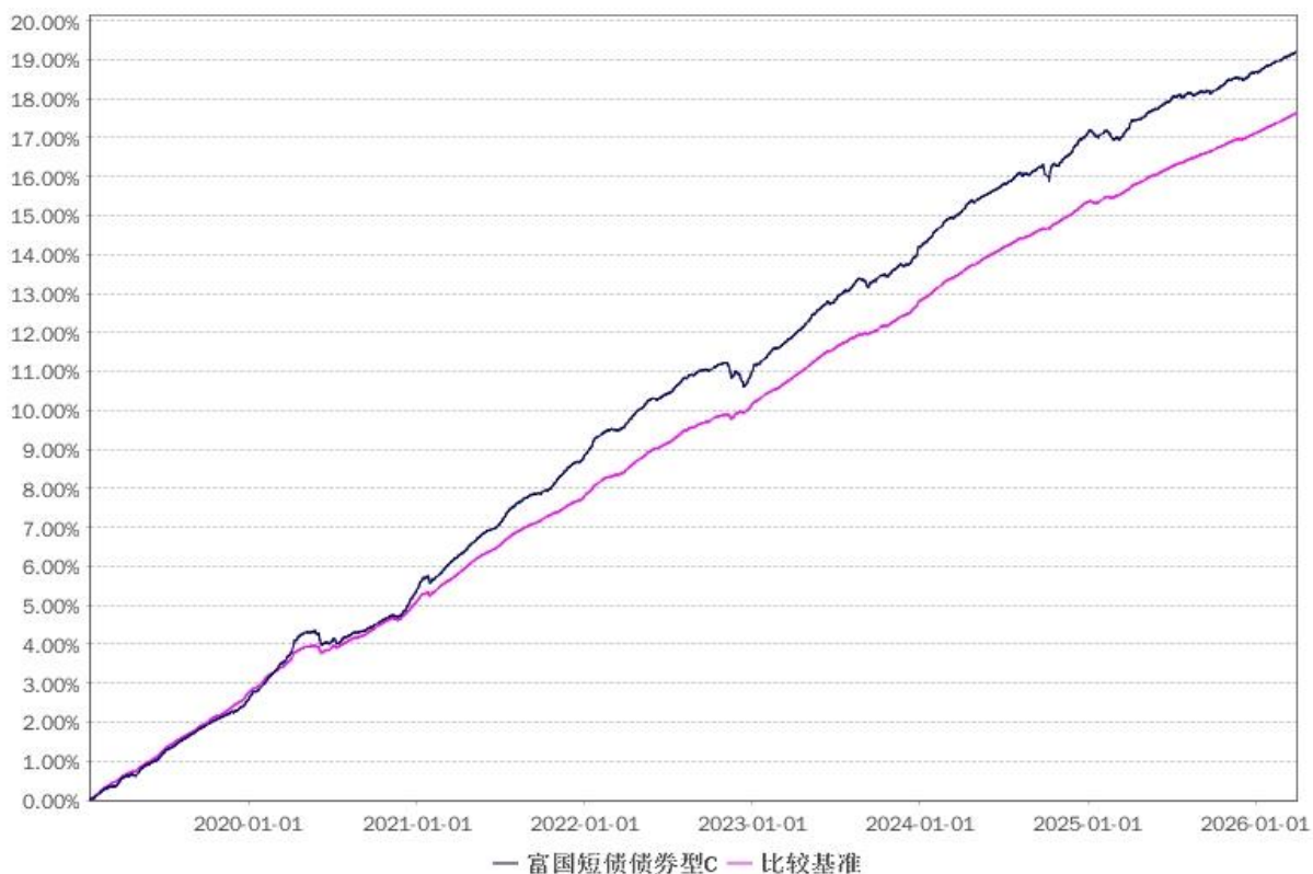
率的历史走势对比图