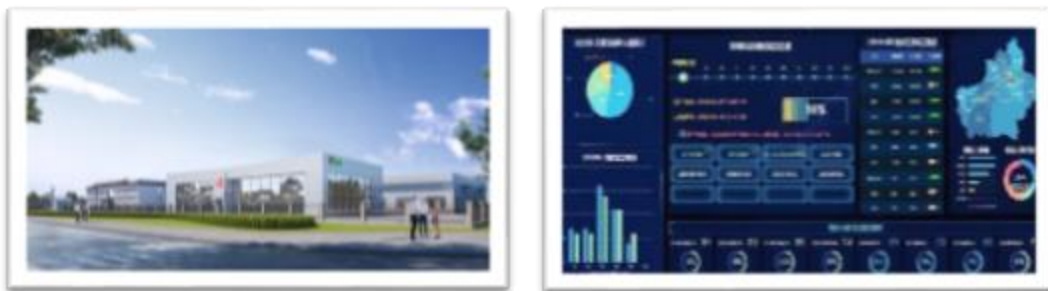
图4：胡杨河天鹅智慧农业综合服务项目鸟瞰图、高端采棉机智能制造调度中心

启动“质量提升、服务升级”三年行动，成立质量提升领导小组，从设计、生产、采购、质检、辅机、工程等方面，对存在的问题进行全面梳理，找差距、补短板，加强全过程质量控制。同时，为适应公司业务结构变化，不断提高品牌影响力和市场竞争力，报告期内，启动智慧农业综合服务项目，成立胡杨河天鹅智慧农业科技有限公司负责项目建设和运营，购置土地31,970.78平方米，项目涵盖展厅、检修车间、仓储中心、智慧服务调度中心等，全面升级公司主机销售、配件供应、物流配送、调试及维修服务、信息反馈五位一体的“5S”服务体系。公司积极推进生产制造数字化升级，购置一批自动数控加工装备，其中高端采棉机智能生产线MES系统及生产调度中心上线运行，生产制造自动化、精细化、数字化水平不断提高。