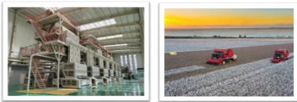
图 3：公司 60 包/时机采棉生产线、打包采棉机应用场景图

报告期内，公司积极与产业链上下游、科研院所等开展关键核心技术联合攻关，牵头组织召开山东省重大科技创新工程项目、自治区农机研发制造推广应用一体化试点项目等项目的实施交流会，参与完成“十四五”国家重点研发计划项目启动会等。子公司新疆天鹅入选兵团农机装备产业链链主企业，牵头创建兵团首家农机装备制造业创新中心，与石河子大学在机械工程领域共建自治区产学研联合培养研究生示范基地，为不断提高公司创新能力奠定了坚实基础。