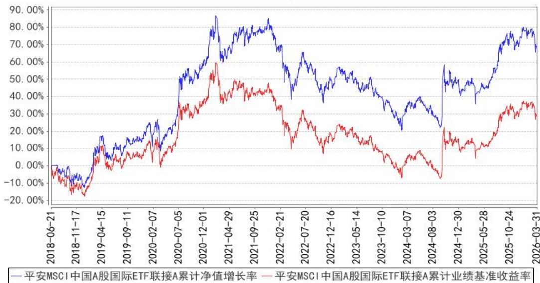
平安MSCI中国A股国际ETF联接A累计净值增长率与同期业绩比较基准收益率的历史走势对比图