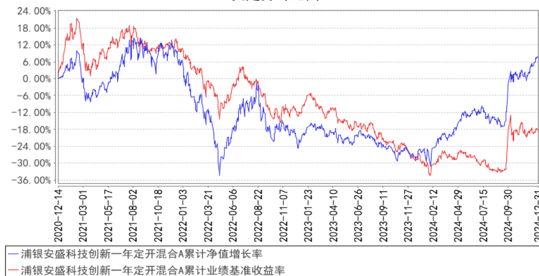
浦银安盛科技创新一年定开混合A累计净值增长率与同期业绩比较基准收益率的历史走势对比图