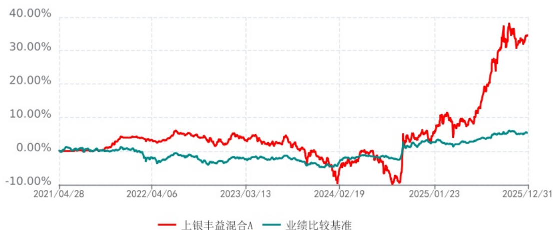
上银丰益混合C累计净值增长率与业绩比较基准收益率历史走势对比图