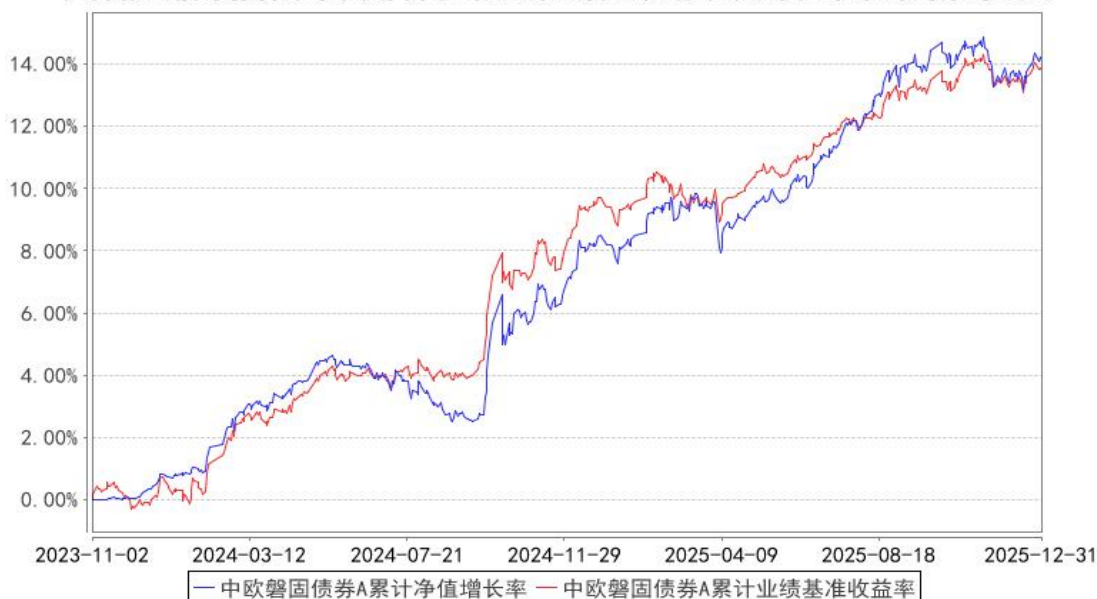
中欧磐固债券A累计净值增长率与同期业绩比较基准收益率的历史走势对比图