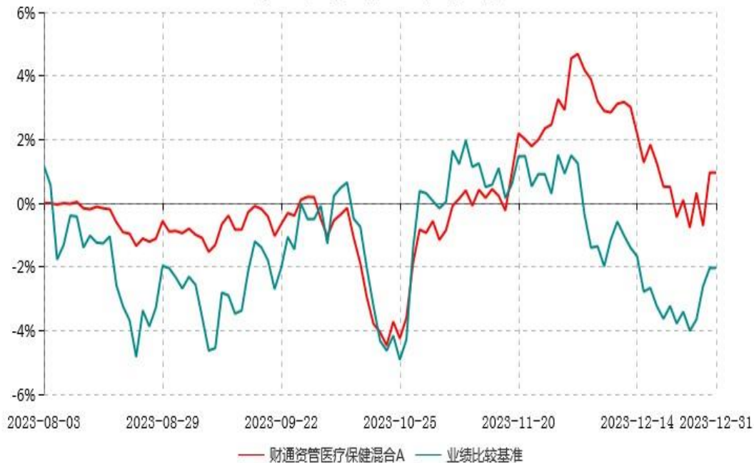
财通资管医疗保健混合A累计净值增长率与业绩比较基准收益率历史走势对比图 (2023年08月03日-2023年12月31日)