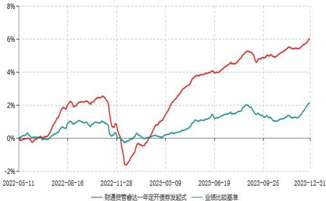
财通资管睿达一年定期开放债券型发起式证券投资基金累计净值增长率与业绩比较基准收益率历史走势对比图 (2022年05月11日-2023年12月31日)