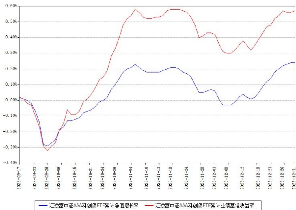
汇添富中证AAA科创债ETF累计净值增长率与同期业绩基准收益率对比图

注：本《基金合同》生效之日为 2025 年 09 月 17 日，截至本报告期末，基金成立未满一年。本基金建仓期为本《基金合同》生效之日起 6 个月，截至本报告期末，本基金尚处于建仓期中。