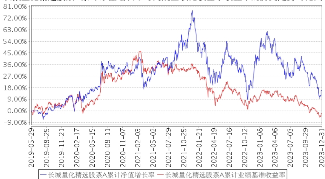
长城量化精选股票A累计净值增长率与同期业绩比较基准收益率的历史走势对比图