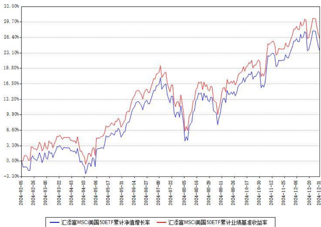
汇添富MSCI美国50ETF累计净值增长率与同期业绩基准收益率对比图