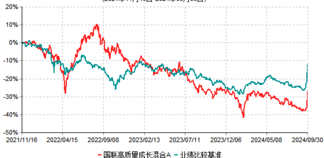
国联高质量成长混合A累计净值增长率与业绩比较基准收益率历史走势对比图 (2021年11月16日-2024年09月30日)