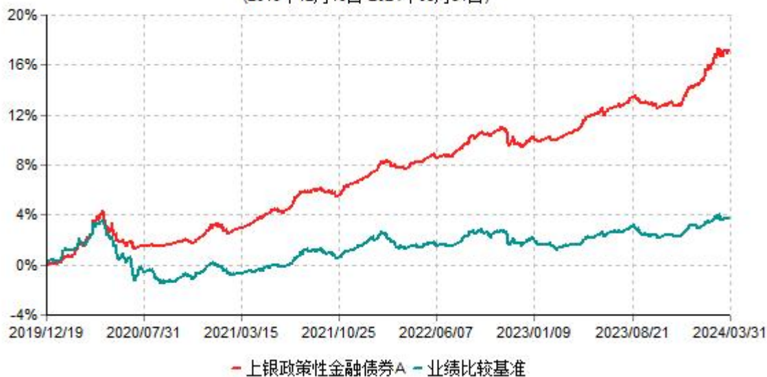
上银政策性金融债券A累计净值增长率与业绩比较基准收益率历史走势对比图 (2019年12月19日-2024年03月31日)