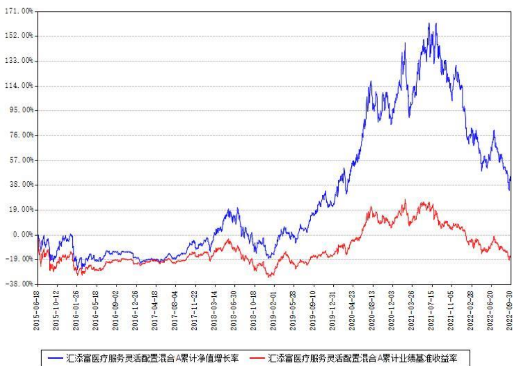
汇添富医疗服务灵活配置混合A累计净值增长率与同期业绩基准收益率对比图

(二) 自基金合同生效以来基金累计净值增长率变动及其与同期业绩比较基准收益率变动的比较图