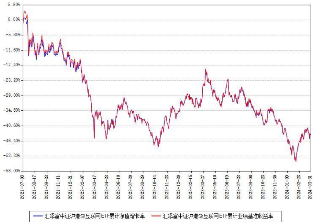
汇添富中证沪港深互联网ETF累计净值增长率与同期业绩基准收益率对比图